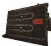
Hydraulic Second Transmitter Chain Type Tool Magazine