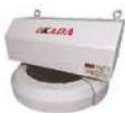
Armless Type Tool Magazine (10T,12T,16T,20T)