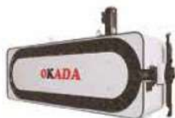
Horizontal Chain Type Tool Magazine