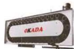
50# Chain Type Tool Magazine (32T,40T,60T,80T)