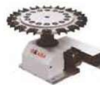
Umbrella Type Tool Magazine (Customized)