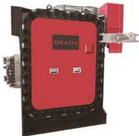
Hydraulic Vertical-Horizontal Turning Type Tool Magazine (32T,40T,60T,80T,100T,120T,180T)