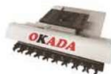
Straight Row Type Tool Magazine