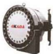
50# Horizontal Disc Type Tool Magazine (24T,30T)