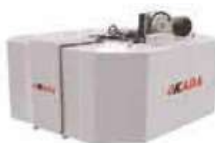
Vertical Lathe Type Tool Magazine (6T,8T,12T,16T)