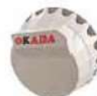
Tapping Tool Magazine

V případě zájmu nás kontaktujte na mailu: consenta@consenta.cz , mobil:+420/736 640 213