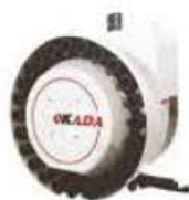
40# Vertical Disc Type Tool Magazine (16T,20T,24T,26T,30T,32T,36T)