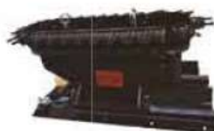
Flat Chain Type Tool Magazine