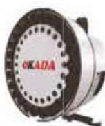
50# Vertical Disc Type Tool Magazine (16T,24T,30T)